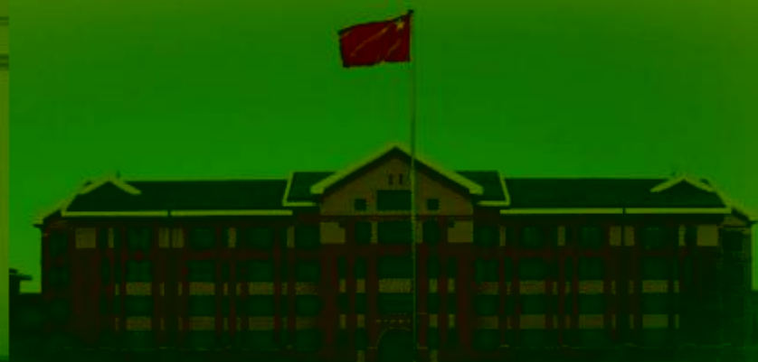
天津机电职业技术学院

TIANJIN VOCATIONAL COLLEGE OF MECHANICAL AND ELECTRICAL ENGINEERING